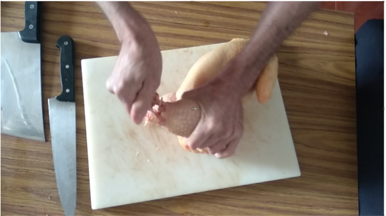
Sujeta, gira y tira

Para retirar el esqueleto necesitaras un cuchillo fino y bien afilado introdúcelo entre el esqueleto y la carne y ve cortando poco a poco para desvestir el pollo. Para separa el contra muslo del esqueleto dobla en sentido contrario la articulación y con ayuda del cuchillo sepáralo. Has lo mismo con las alas.