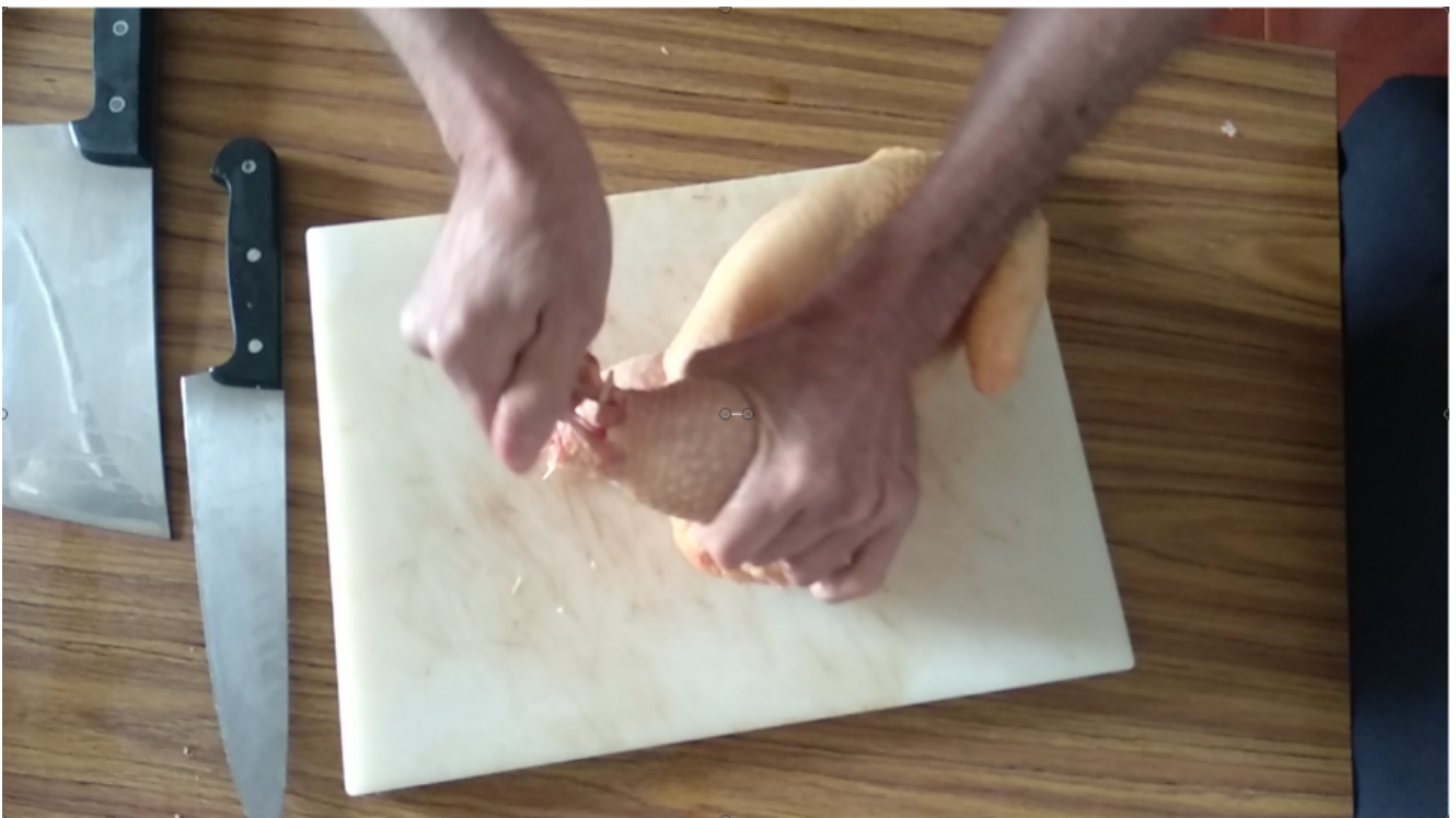
Sujeta, gira y tira

Para retirar el esqueleto necesitaras un cuchillo fino y bien afilado introdúcelo entre el esqueleto y la carne y ve cortando poco a poco para desvestir el pollo. Para separa el contra muslo del esqueleto dobla en sentido contrario la articulación y con ayuda del cuchillo sepáralo. Has lo mismo con las alas.