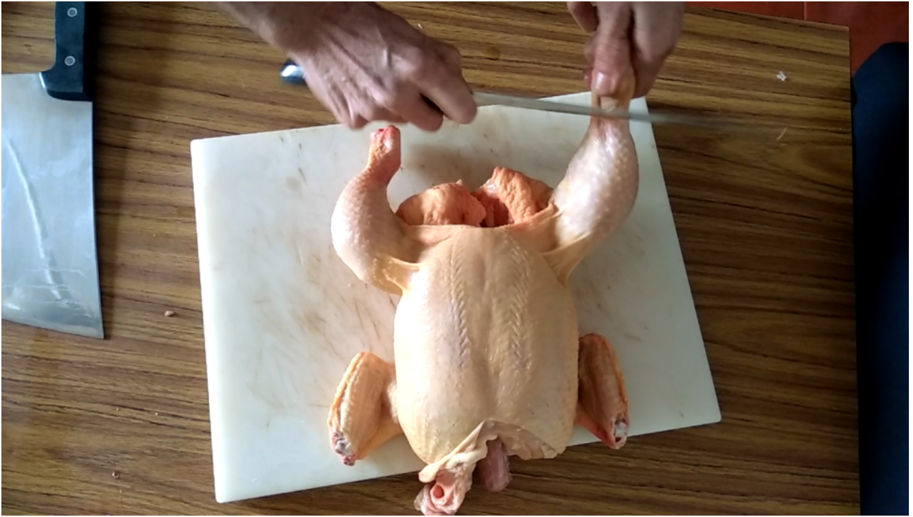
Corte alrededor del hueso del muslo